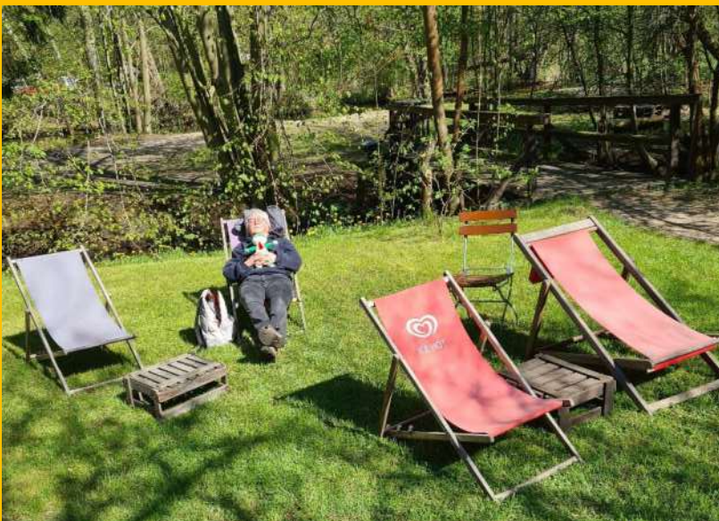
Relaxen in der Sonne